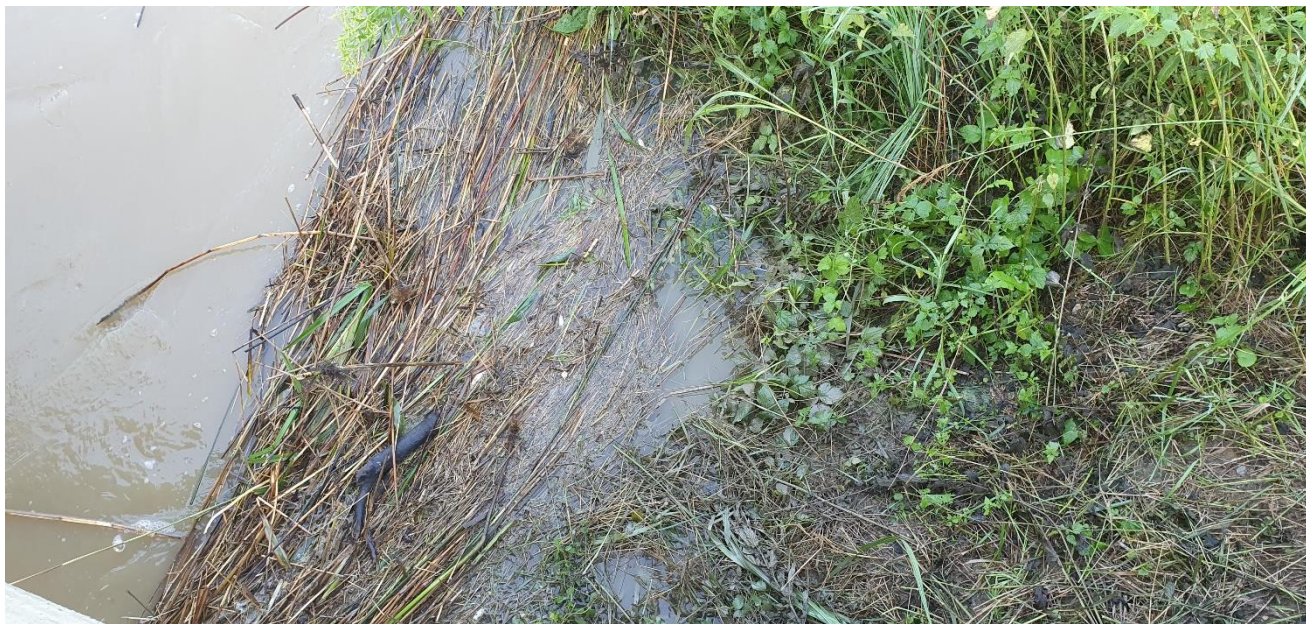
Uginule ribe – most Đelekovec – 26.07.2020.

www.piskornica-sanacijsko-odlagaliste.hr