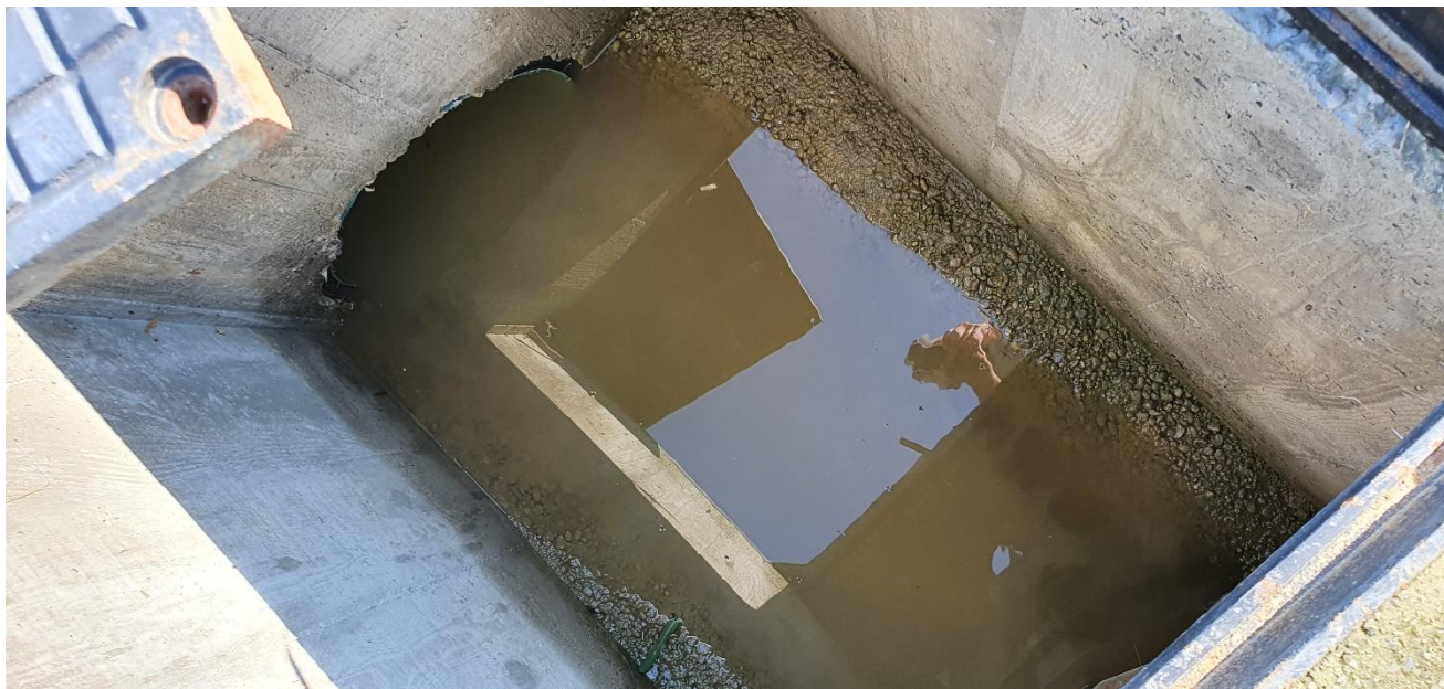
Stanje okna sa zapornicom neposredno prije ispusta u odvodni kanal – 26.07.2020.

www.piskornica-sanacijsko-odlagaliste.hr