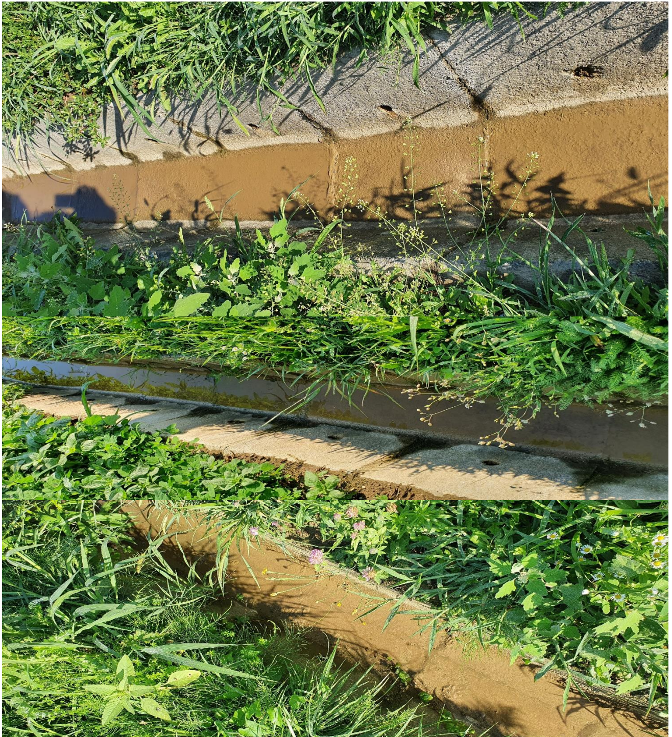
Stanje obodnog kanala oko tijela odlagališta – 26.07.2020.

Kao prilog uvida u stanje odlagališta na dan 26. srpnja 2020. godine nalazi se i slijedeća foto dokumentacija: