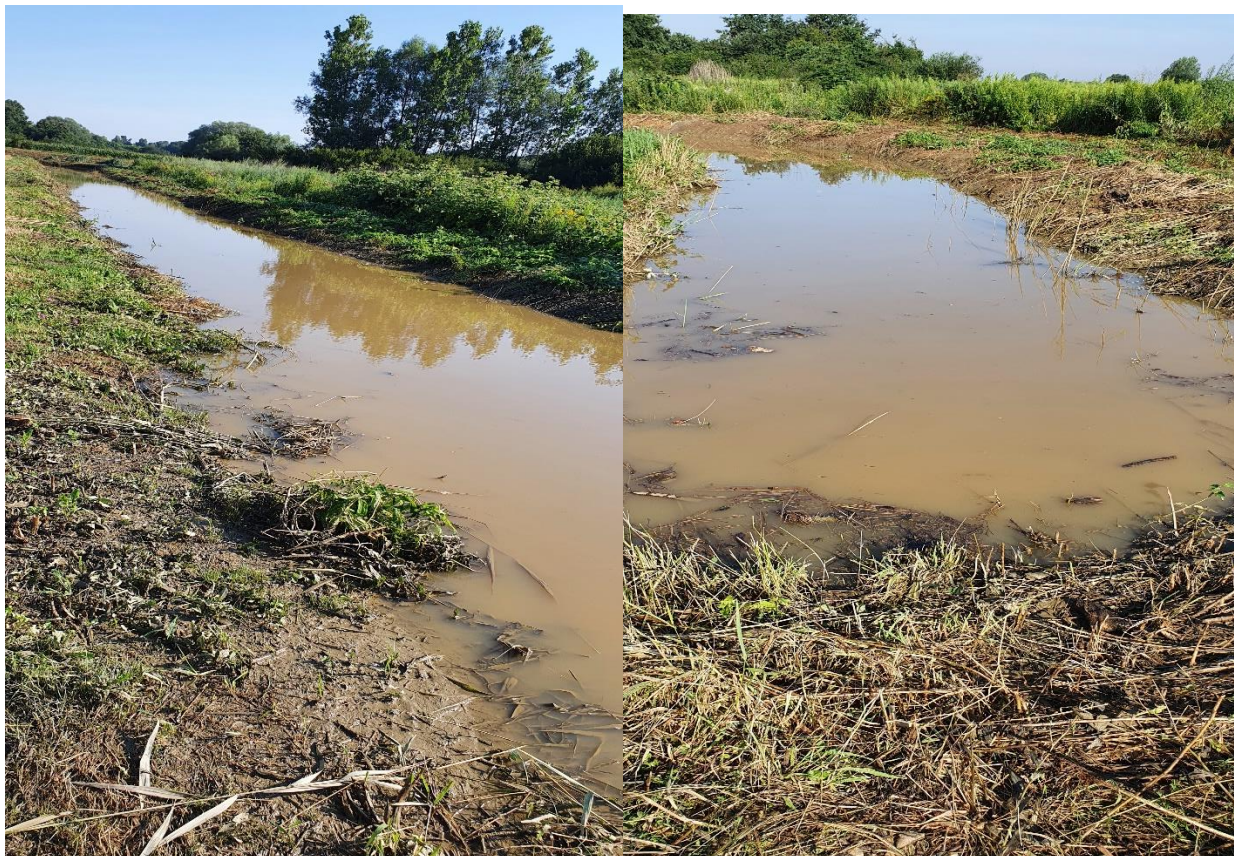
Stanje odvodnog kanal oborinskih voda prema potoku Gliboki 26.07.2020.