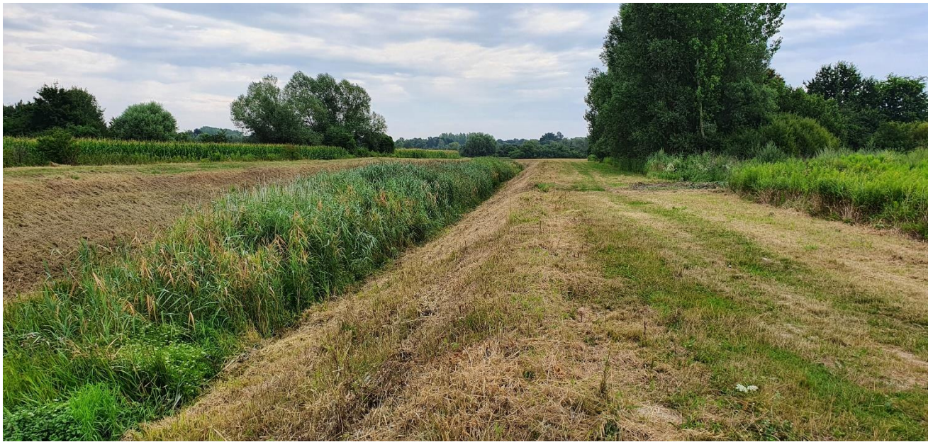
Stanje potoka Gliboki nizvodno prema mostu Đelekovec – 24.07.2020.

www.piskornica-sanacijsko-odlagaliste.hr