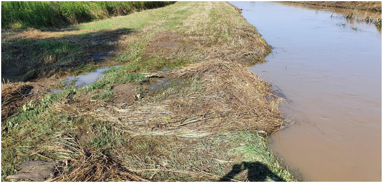
Stanje mjesta spajanja odvodnog kanala i potoka Gliboki – 26.07.2020.

www.piskornica-sanacijsko-odlagaliste.hr