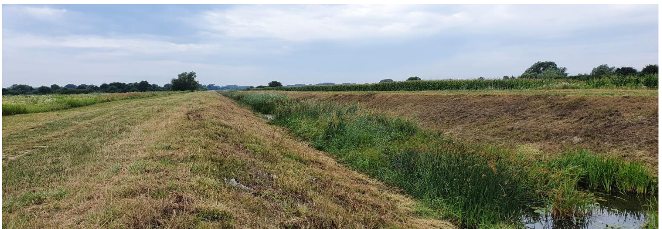
Stanje potoka Gliboki prema naselju Pustakovec – 24.07. 2020.