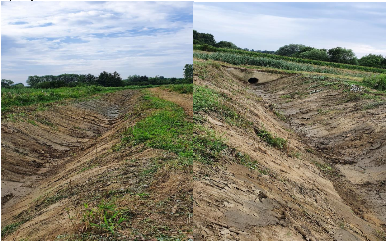
Odvodni kanal oborinskih voda sa odlagališta Piškornica prema potoku Gliboki – 24.07.2020.

Kako je dana 24. srpnja 2020. godine izvršen redovni inspekcijski nadzor od strane vodopravne inspekcije i tom prilikom izvršen uvid u stanje potoka Gliboki u nastavku se nalaze fotografije stanja potoka Gliboki, a koje su i ujedno sastavni dio Zapisnika navedene inspekcije.