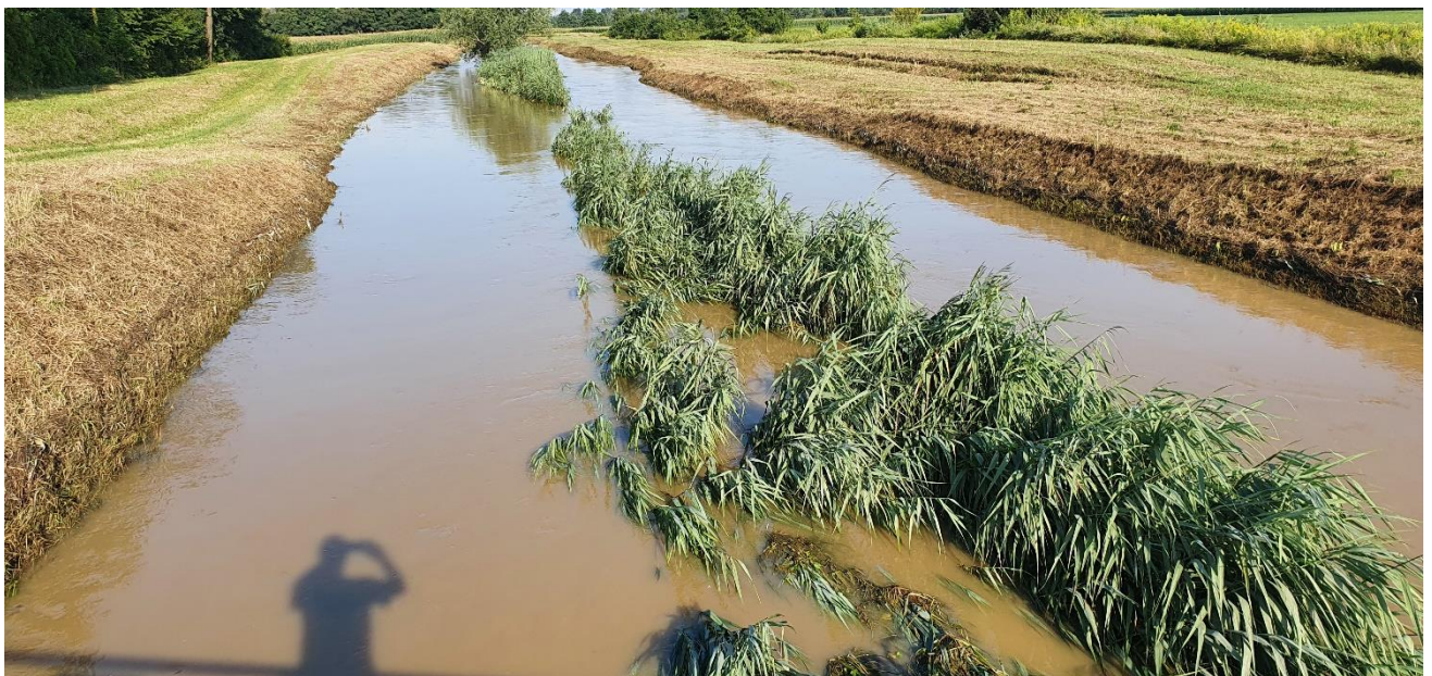
Potok Gliboki – most Pustakovec – 26.07.2020.